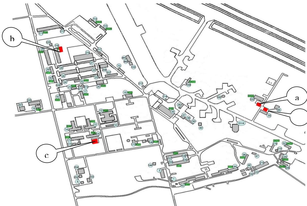
Obr. č. 2 – Místa pro trvalé parkování zaměstnanců letiště Přerov